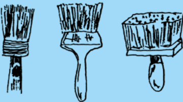
De gauche à droite : brosse algérienne, brosse à plafond et brosse alsacienne

Eteindre la chaux avec un peu d'eau bouillante puis la passer au tamis fin. Ajouter la solution salée et le blanc, puis la colle dissoute dans l'eau bouillante et la terre colorante.